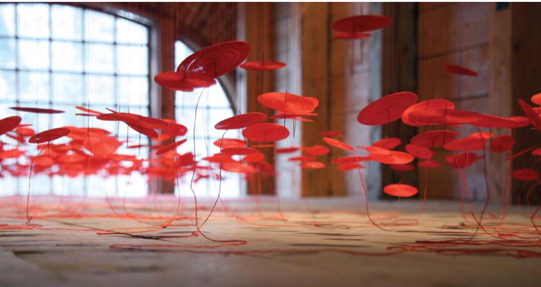
刘北立装置艺术作品：《惑》

在“惑”中，她描绘了一个关于一对从出生就被红线捆绑在一起的爱人的传说。随着时间的流逝，这个红色的线就把他们越拉越近直到最后她们跨越社会和文化的分歧互相找到对方。这件作品，是一件运用红线做成的