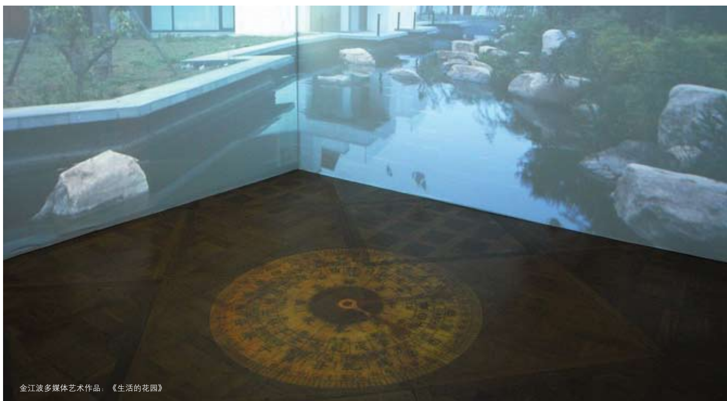
金江波多媒体艺术作品：《生活的花园》